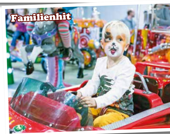
Kinder sind die Entscheider von morgen, und die mensch&tier hat sich mit einem tollen Rahmenprogramm und vielen Möglichkeiten für Kinder zum Familienhit „gemausert“. Damit tragen wir nicht nur zur Bewusstseinsbildung im richtigen Umgang mit Tieren bei, wir geben Ihnen auch die Möglichkeit, Ihre Kunden von Morgen kennenzulernen.