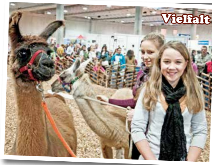
Als einzige Großveranstaltung in Österreich gelingt es der mensch&tier, den unglaublich großen Bogen über nahezu alle Tierarten zu spannen. Da dürfen Besonderheiten wie Lamas und Alpakas natürlich auch nicht fehlen. Das vielseitige Programm spricht Familien wie Fachbesucher gleichermaßen an und gibt Raum für Information und Erweiterung der persönlichen „tierischen Interessen“.