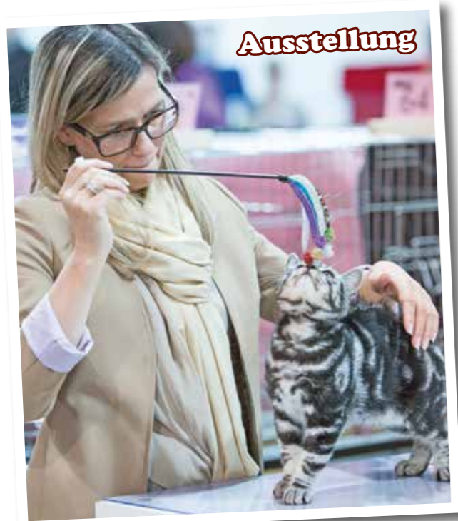
Samtige Pfoten, seidenes Fell, funkelnde Augen – schon mehrfach war die mensch&tier Gastgeber einer internationalen Katzensausstellung. Mit der diesjährigen Ausstellung der schönsten Stubentiger bietet die Messe auch 2019 das ideale Umfeld, um Produkte und Dienstleistungen, rund um Haltung, Pflege und Gesundheit von Katzen zu präsentieren.