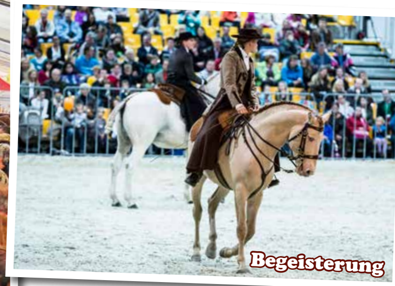
Eine weitere Besonderheit der mensch&tier: Eine Pferdearena mit 800 qm Größe. Am Reitplatz auf der sympathischen Tiermesse warten spannende und mitreisende Pferdeshows – aber auch das Shopperlebnis rund um die eleganten Vierbeiner darf nicht zu kurz kommen...