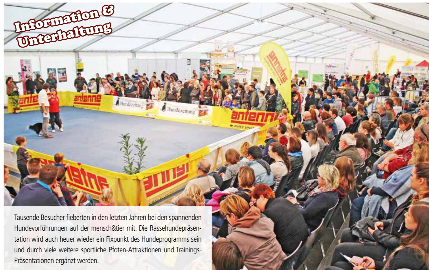
Tausende Besucher fieberten in den letzten Jahren bei den spannenden Hundevorführungen auf der mensch&tier mit. Die Rassehundepäsentation wird auch heuer wieder ein Fixpunkt des Hundeprogramms sein und durch viele weitere sportliche Pfoten-Attraktionen und Trainings-Präsentationen ergänzt werden.

Die größte und erfolgreichste Tiermesse Südosterreichs, die „mensch & tier 2019“ findet heuer bereits zum achten Mal statt – natürlich wieder an der TOP-Event Location am Schwarzl Freizeitgelände bei Graz. Wieder werden 10.000 – 15.000 Besucherinnen und Besucher erwartet – wieder lockt der Publikumshit mit vielen Tieren, großartigen Event, noch mehr Shopping und ganz viel tierischer Information. Seien auch Sie wieder ein Teil der „mensch & tier“ Familie und präsentieren Sie sich und Ihr Unternehmen / Ihre Institution den abertausend Tierfans, die alljährlich zur sympathischen Familienmesse pilgern!